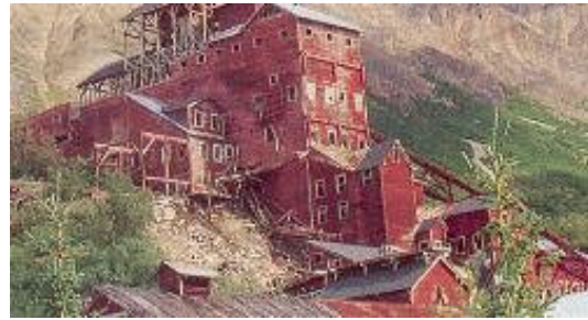
Kennicott Copper Mine

Tour und Besichtigung der historischen Kennicott Kupfermine.