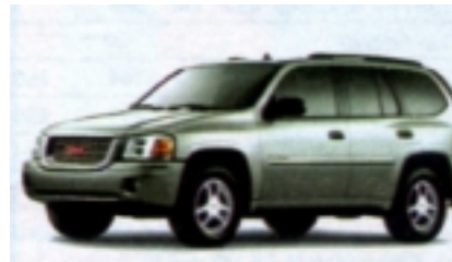
Standard SUV ( Jeep Grand Cherokee, GMC Encoy o.ä.) für 4 Personen mit Gepäck, Automatik, Servolenkung, Tempomat, AVS, Airbags,

Diese Tour ist für Kinder und Einzelreisende nicht geeignet.