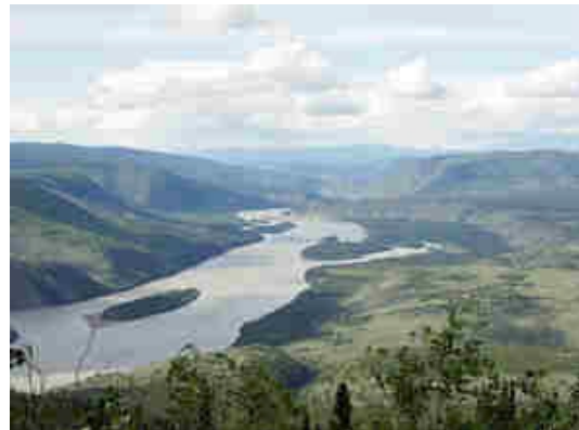
Yukon bei Dawson City

Es geht wieder zurück zum Klondike Hwy und dann weiter nach Norden in die berühmte Goldgräberstadt Dawson City, Zentrum des alaskanischen Goldrauschs. 2Übern. Eldorado Hotel