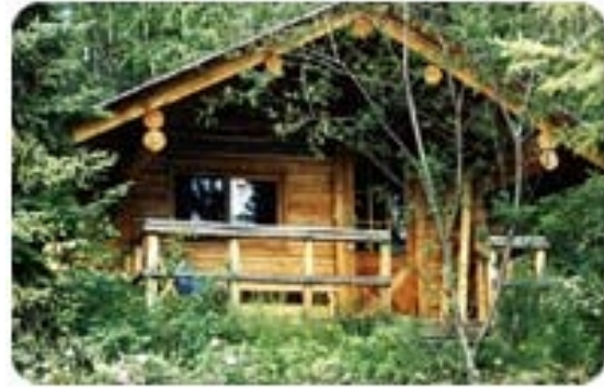
France Lake Lodge Cabin

Duschen befinden sich in einem sep. Waschhaus mit Sauna.