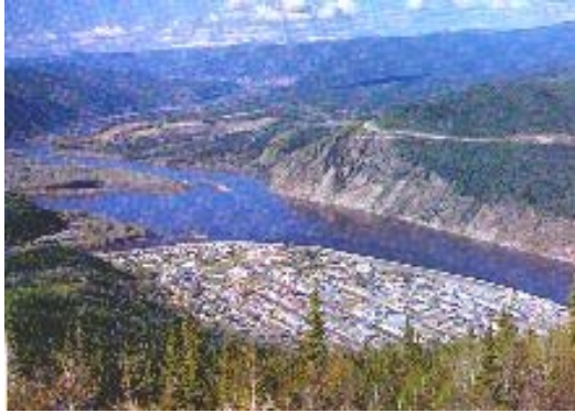
9.Tag Dawson City