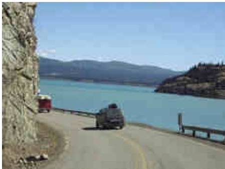
am Kluane Lake

Mit der kleinen Yukonfähre geht es über den Yukon River und dann auf dem berühmten Top of the World Hwy nach Alaska. Sie müssen heute ein Stück durch Alaska fahren. Auf dem Alaska Hwy fahren Sie am Nachmittag aber wieder zurück in den Yukon und übernachten in dem kleinen Ort Beaver Creek. Hotel Westmark