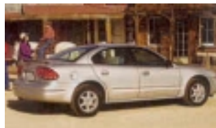
Midsize: Fahrzeug der Mittelklasse etwa vergleichbar mit Opel Vectra. Gut geeignet für 2 Personen mit Gepäck

Unterkunft: in guten Mittelklassehotels in touristisch guter Lage und in Nationalparks; alle Zimmer mit Bad/WC, TV, Telefon und Klimaanlage Auto: Mietwagen „All Inklusiv“ mit unbegr. Meilen, CDW Haftpflichtvers. ohne Selbstanteil des Mieters, Zusatzhaftpflichtversicherung 1,5 Mio € 1. Tankfüllung, alle Zusatzfahrer über 25 Jahren, Personen- Insassenversicherung, Gepäckversicherung (ausg. an New York). Für Fahrer 21-25 Jahren ist am Ort eine Zusatzversicherung abzuschließen (20$/Tag) . Soweit mehrere Fahrten zw. 21 und 25 Jahre sind empfehlen wir unseren Tarif „Under 25“ der etwa 5€ je Tag höher ist, aber dann günstiger als die am Ort zu zahlenden Versicherung.