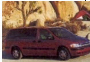
MiniVan: 7-Sitzer, ideal für 4 Erwachsene mit Gepäck, vergleichbar mit Opel Zafira

Alle Fahrzeuge haben autom. Getriebe, Klimaanlage, Servobremsen und Servolenkung, Radio, CD-Player. Wir vermitteln Fahrzeuge renommierter Vermietunternehmen wie z.B. Alamo, Budget, National, Avis, Hertz. Sollten Sie einen bestimmten Vermieter wünschen, geben Sie dies bitte bei Ihrer Anfrage an.