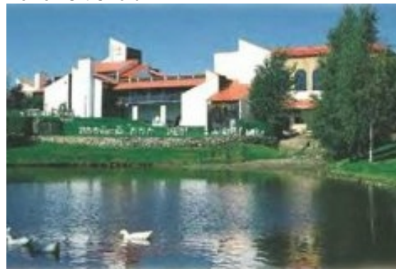
2 Übern. Hotel Cheribough

Von Montreal geht es zuerst in südlicher Richtung zum Lake Champlain und nach einem kurzen Abstecher in die USA und durch den Staat Vermont wieder zurück nach Kanada, um den kleinen Ort Orford.