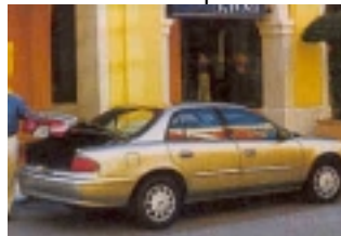
Fullsize: Fahrzeug der gehobenen Mittelklasse etwa vergleichbar mit Opel Omega. Gut geeignet für 2 Erw. und 2 Kinder mit Gepäck