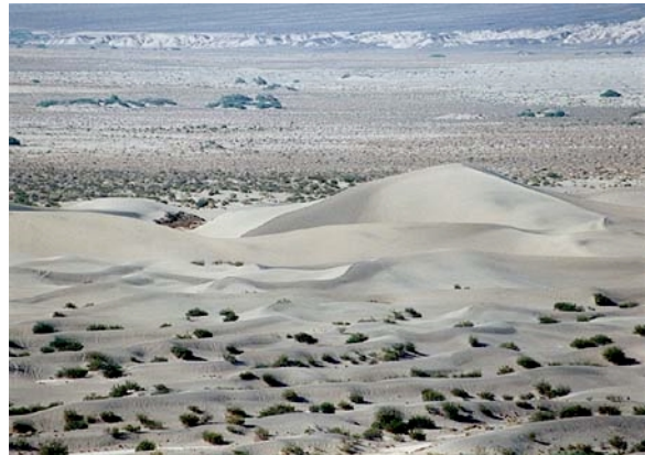
Sanddünen im Death Valley