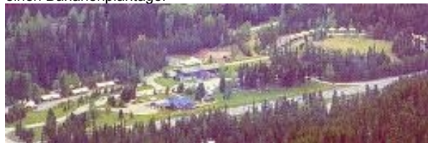
Übern. Manning Park Resort

Der Manning Prov. Park ist ein sehr schönes Wandergebiet und vom Manning Park Resort gelangen Sie schon in wenigen Minuten in dichte Wälder. Es gibt auch Gelegenheiten für eine mehrstündige Reittour. Man kann auch zwischen Penticton und Manning Park einen interessanten Abstecher nach Osoyoos machen. (ca. 50km mehr) Osoyoos ist klimatisch und landschaftlich völlig anderes, es ist ein kleines Wüstengebiet, sehr heiß im Sommer und kalt im Winter. Es ist hier ausgesprochen trockenes Wetter und hier bei Osoyoos gibt es sogar einen Bananenplantage.