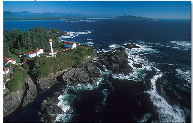
Lennard Lighthouse bei Tofino

An der abwechslungsreichen Küste von Vancouver Island fahren Sie zuerst einmal nach Norden , ehe es dann quer über die Insel auf einer kurvenreichen , achterbahnähnlichen Straße zur offenen Pazifikseite, zum Pacific Rim Nat.Park geht. Sie wohnen in Tofino im Hotel Middle Beach Lodge. (2 Übern)