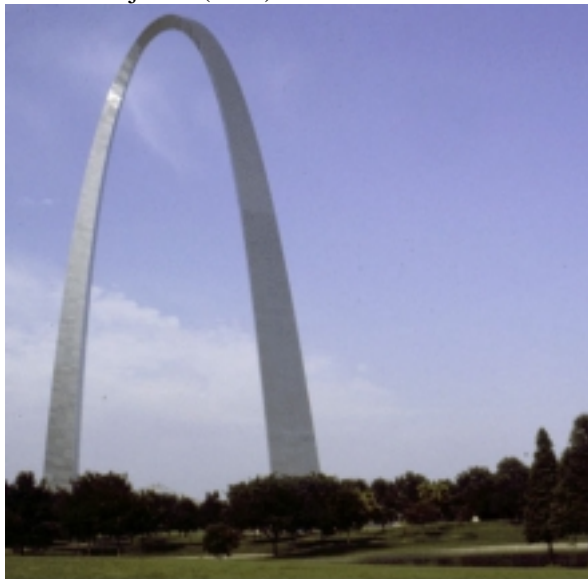
der Gateway Arch – das Tor zum Westen – in St. Louis.

Inzwischen sind Sie im Staat Missouri und erreichen mittags St. Louis, das Tor zum Westen. Von hier aus starteten im 19.Jahrhundert zahlreiche Expeditionen um den unbekanntem Westen zu erforschen, so auch Lewis und Clark, die dem Missouri aufwärts folgten und nach 2 Jahren bei Portland den Pazifik erreichten. Hier in St.Louis kommt der größte Zufluss, der Missouri River, zum Mississippi. 2 Übern. im Hotel Hampton Inn .(STD) bzw. OMNI Majestic (SUP)