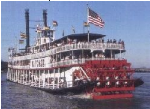
Eine Dinner Cruise auf dem Mississippi sollte man nicht auslassen.

Sie haben Zeit diese besondere Stadt zu entdecken, bummeln Sie am Flussufer entlang, genießen Beignets im Cafe du Monde und anschl. geht es zum Farmers Market. Unbedingt muss man die typische Cajun Küche probieren. Jambalaya (eine Art Paella) und Poboys (Sandwiches) gehören unbedingt dazu. Es gibt eine Vielzahl Spitzenrestaurants, man kann aber auch sehr gut und preiswert in kleinen, einfachen Restaurants speisen.