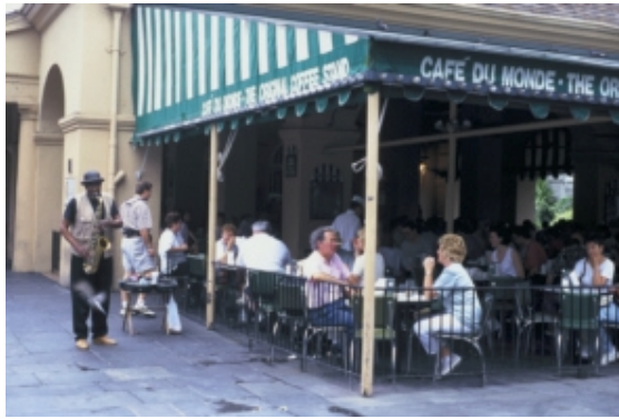
Cafe du Monde