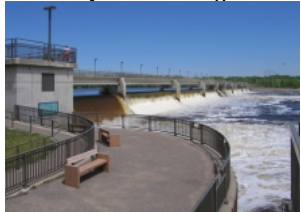
Coon Rapids Dam im Nordwesten von Minneapolis

Mitten durch die Doppelstadt Minneapolis – St.Paul schlängelt sich der Mississippi River.