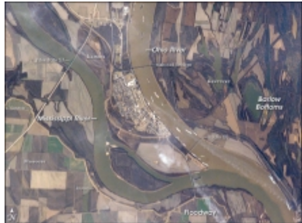
Der Zusammenfluss von Ohio River und Mississippi River bei Cairo

Auf diesem Streckenabschnitt kann man nur auf kurzen Stücken am Fluss entlang fahren. Cairo ist ein kleiner Ort, im südlichsten Zipfel des Staates Illinois, wo der Ohio River in den Mississippi mündet. Übern. im Hotel Days Inn (STD) oder Courtyard by Marriott in Paducah.