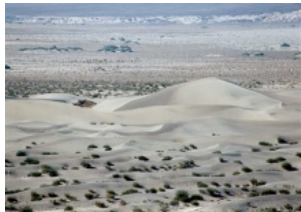
Sanddünen im Death Valley

Übern.TOU: BW China Lake Inn Ridgecrest und Furnace Creek Ranch (STD)