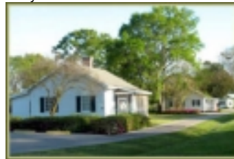
Oak Alley Plantation Cottages

liegt unmittelbar hinter dem Mississippi-Damm und wird liebevoll die „Grande Dame“ an der Riverroad genannt. Die alte Zufahrt zum Plantagenhaus wird von 300 Jahre alten Eichen gesäumt. Die Unterkunft ist in kleinen Cottages, die um 1880-1890 als Wohnungen für die Bediensteten erbaut wurden. Es stehen vier dieser kleinen Häuser zur Verfügung. Oak Alley Plantation liegt ganz einsam. Genießen Sie diese Ruhe und den malerischen Sonnenuntergang über den Mississippi. Country Frühstück wird im Restaurant von Oak Alley serviert.