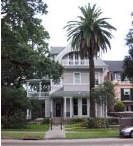
Grand Victorian Inn B&B

Nach der Ankunft Fahrt in die Innenstadt. 2 Übernachtungen im Grand Victorian Inn B&B