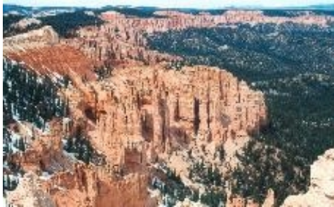
12.Tag Bryce Canyon

11.Tag Page - Bryce Canyon 250 km Durch den Süden des Staates Utah geht es nach Kanab, das auch „Little Hollywood“ genannt wird, da hier zahlreiche Westernfilme gedreht wurden. Mittags erreichen Sie den Bryce Canyon, eine der eindrucksvollsten Nationalparks im Südwesten.