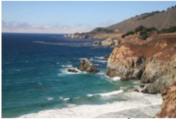
Meer sich sonnende Seelöwen sehen. Übernachtung