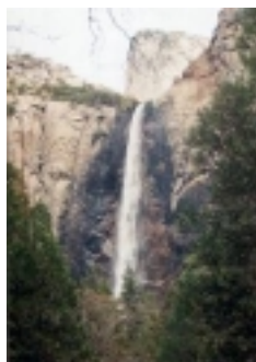
Bridalfall Yosemite NP

Auf der berühmten Route 49, der Straße des Goldrausch – geht es entlang der Sierra Nevada zum Yosemite National Park. Unterwegs gibt es noch einige Goldgräberorte und Ghosttowns. Übernachtung