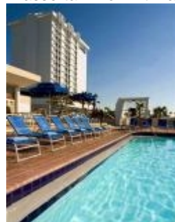
Hotel Bahia Mar

Ft.Lauderdale wird auch das Venedig Amerikas wegen der unzähligen Kanäle und Brücken genannt . Mit dem Wassertaxi kommt man meist schneller ans Ziel.