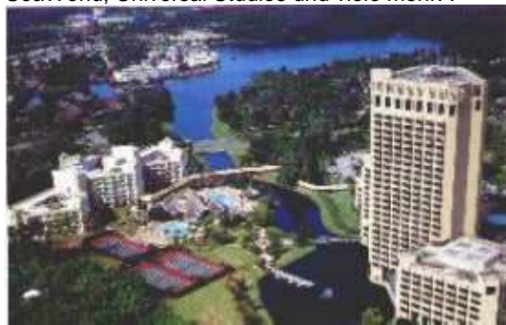
Lake Buena Vista nahe Disney World

Mit dem eigenen Wagen oder auch per Shuttlebus kann man die vielen Attraktionen in und um Orlando erreichen, wie.z.B. Disney World, Epcot Center, SeaWorld, Universal Studios und viele mehr. .