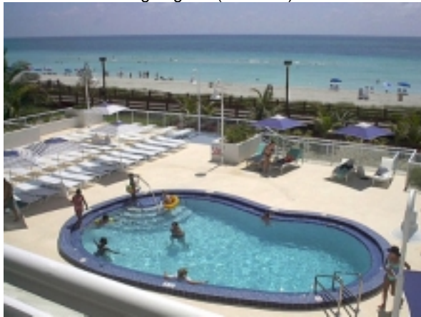
Pool und Strand Atlantik Beach Resort

Nach der Ankunft in Miami Übernahme des Mietwagens und kurze Fahrt zum Hotel Best Western Atlantic Beach Resort, direkt am schönen Sandstrand von Miami Beach gelegen. (4 Übern.)