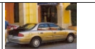
Kat: H Midsize: