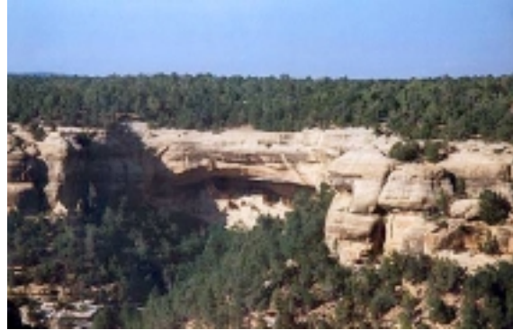
Mesa Verde Cliff Palace

Nach 150km erreichen Sie „Four Corner“, wo die vier US Bundesstaaten Arizona, Colorado, New Mexico und Utah aneinander stoßen.