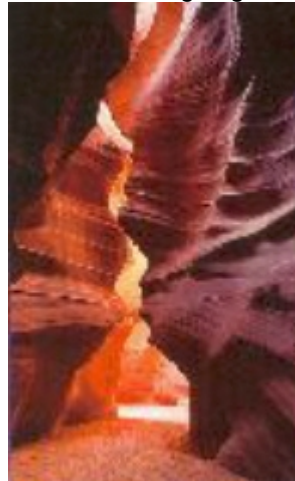
Antelope Canyon bei Page

Am Grand Canyon Southrim entlang zur Little Colorado Schlucht. Die weitere Strecke durch Navajo Indianerland nach Page ist abwechslungsreich und interessant. Übern. im Quality Inn (TOU + STD) in zentraler Lage im Ort Page, oder im Lake Powell Resort (SUP) direkt am See gelegen