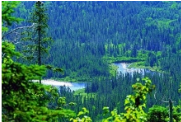
Chic Choc Mountains