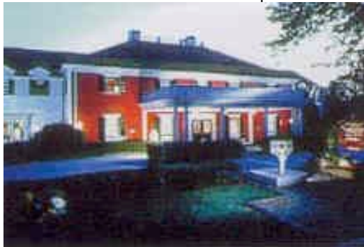
Übernachtung im Country Inn Dan'l Webster

Neben dem schönen Segelhafen mit attraktiver Promenade und erstklassigen Restaurants, hat man hier zahlreiche pompöse Herrenhäuser aus der ersten Hälfte des 20. Jahrhunderts. Hier baute sich der amerikanische Geldadel elegante Sommersitze, die man jetzt zum Teil besichtigen kann. Anschl. Kurze Weiterfahrt nach Sandwich auf Cape Cod.