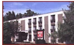
Übern. im Summit Hotel Lake Placid.