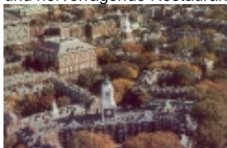
Harvard Universität Cambridge / Boston

Die sehr europäisch wirkende Stadt hat eine Menge an Historie zu bieten. Man kann die Stadt sehr gute zu Fuß entdecken und am Abend trifft man sich in der Altstadt am Quincy Market. Hier findet man tolle Pubs und hervorragende Restaurants.