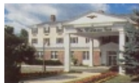
Hotel Williams Inn Williamstown

Am malerischen Lake George entlang führt die heutige Etappe in den nordwestl. Zipfel von Massachusetts, in die wunderschönen Berkshire Mountains, nach Williamstown Hotel The Williams Inn. Im Sommer finden in den Berkshire Mnts. Musikfestivals großer Orchester statt.