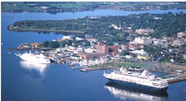
10.Tag nach Charlottetown 160 km

9.Tag Sackville - Prince Edward Insel 180 km Seit 1998 erreicht man diese Insel auf dem Straßenweg, über die neue 13km lange „Confederation Bridge, der weltweit längsten Brücke in einem Eisgangebiet. P.E.I. ist das Farmland und der Garten Ostcanadas. Seit 100 Jahren bauen die Farmer hier zahlreiche Obst- und Gemüsesorten an. Übern. im Hotel Hunter House (STD) bzw. Rodd Mill River Resort (SUP)