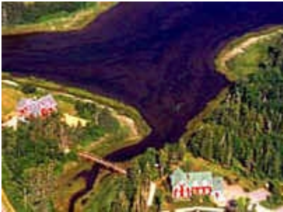
Little Shemogue Inn