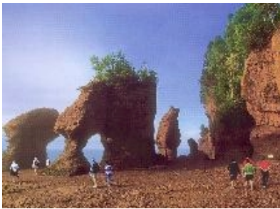
8.Tag Fundy Nat. Park 270 km

Es geht zur Küste, zu einem weiteren landschaftliche Höhepunkt, dem Fundy Nat. Park. Hier an der Küste haben Sie zahlreiche herrliche Aussichtspunkte und können auch am Meer entlang wandern. Aber Achtung. Ebbe und Flut hat einen Wasserstandsunterschied von 16 Metern. Informieren Sie sich also zuerst über die Tidezeiten, denn während der Flut sind die Strandregionen völlig verschwunden. Übern. im Little Shenogue Country Inn