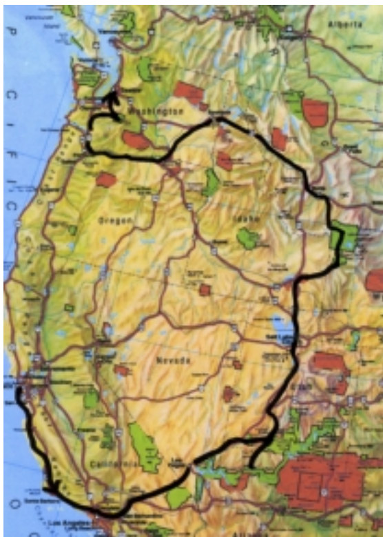
M23a ab Los Angeles

Auf dieser Route besuchen Sie die beliebtesten Nationalparks im Südwesten und Nordwesten der USA . Bei dieser Tour ist sogar der Grand Canyon Northrim – der ansonsten nur selten eingeschlossen ist – enthalten.