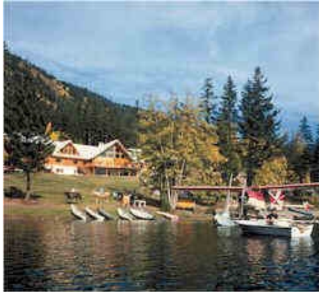
Tyax Mountain Lake Resort