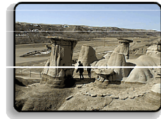
Hoodoos bei Drumheller

Durch den Süden der Provinz Alberta, einem landwirtschaftlich genutzten Gebiet kommen Sie zum Dinosaur Provinzpark. Die Landschaft hier könnte auch auf einem anderen Planeten liegen, so fremd wirkt sie. Hier wurden zahlreiche Dinosaurierskelette gefunden. Auf Lehrpfaden lernt man mehr aus der Zeit der Riesenechsen kennen.