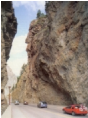
Sinclair Canyon Kootenay NP

Ein kurzes Stück geht es in Richtung Banff weiter, dann zweigen Sie aber wieder nach Westen ab und über den Vermillon Pass kommen Sie zum Kootenay Nationalpark. Sie sollten zwischendurch an den gekennzeichneten Aussichtspunkten halten, es lohnt sich.