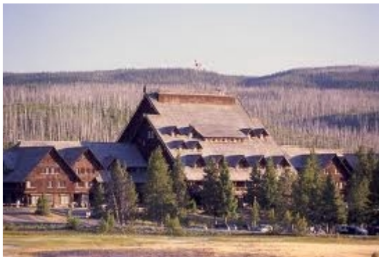
Upgrade möglich z.B. Old Faithful Inn (direkt am Geysir gelegen)

Zimmer Frontside 2 Übern./Zimmer Mehrpreis €220