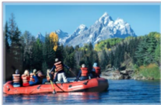
Moran Lake Teton NP

7.Tag Elko – Salt Lake City 355 km Auch der heutige Tag führt überwiegend durch eintönige Landschaft. Kurz vor Salt Lake City führt der Highway direkt am riesigen Salzsee vorbei. Salt Lake City ist die Stadt der Mormonen und interessant ist der zentrale Tempelbezirk. Über. im Hotel Red Lion.