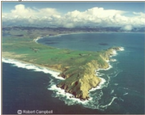
Point Reyes Seashore

Mendocino ist ein malerisches Fleckchen mit vielen viktorianischen Gebäuden und zahlreichen Galerien. Die Straße führt über zahllose Kurven an dieser spektakulären Küste entlang. In dem kleinen Ort Bodega Bay wurde der berühmte Hitchcock Film „Die Vögel“ gedreht. Es folgt südlich der Point Reyes Seashore, eine wilde Naturlandschaft und Vogel-schutzgebiet.