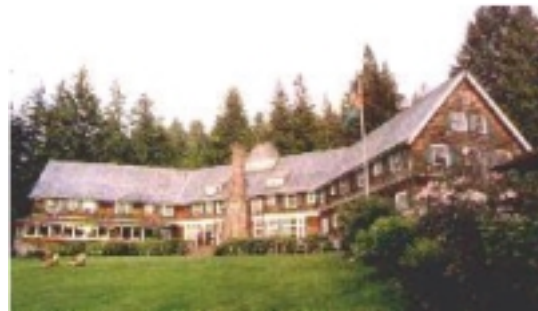
Lake Quinnault Lodge

Im südlichen Teil ist in der wunderschönen Lake Quinnault Lodge eine weitere Übernachtung.