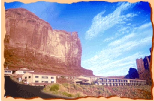
Gouldings Lodge Monument Valley