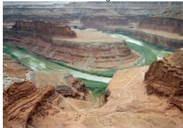
Deadhorse Statepark bei Moab

2 Übern. Hotel Big Horn Lodge in Moab. (SUP: Red Cliff Lodge) Am Nachmittag haben Sie Zeit für die Besichtigung des Arches NP mit seinen beeindruckenden Felsenbögen.