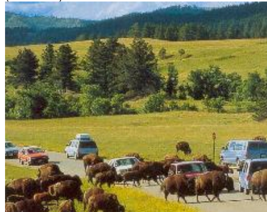
im Custer State Park

Zuerst geht es durch das Grasland Wyoming zu den Black Hills in South Dakota mit dem berühmten „Präsidentenberg“ Mt. Rushmore und dem Crazy Horse Mnt. Der Custer State Park ist ein Teil der Black Hills. Sie übern. in der State Game Lodge Custer State Park (STD+SUP)