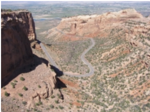
Coloradi Nat. Monument bei Grand Junction

Übern. in Grand Junction im Hotel Grand Vista