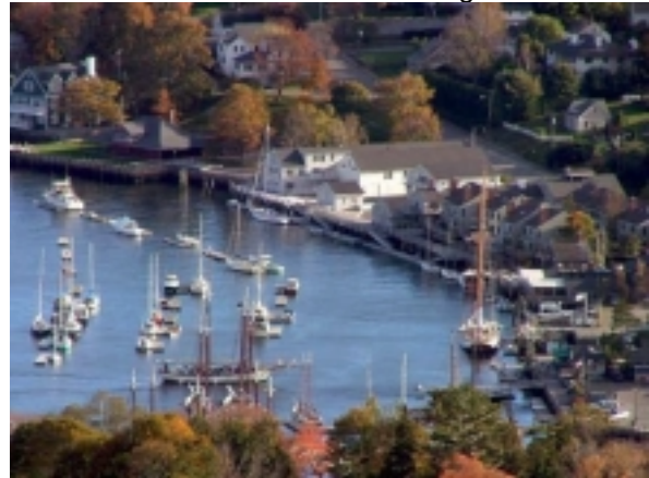
Camden , Maine

Die ganze Tagesstrecke führt mehr oder weniger nah an der attraktiven Küste entlang.